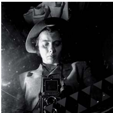
Vivian Maier: Selbstportrait

Ihre Geschichte fasziniert nicht nur Hollywood: Durch einen Zufall wird das unbekannte photographische Werk des Chicagoer Kindermädchens Vivian Maier entdeckt, wodurch