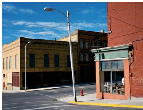
Wim Wenders: Street Corner in Butte, Montana, 2003

Ebenfalls in der Kategorie „Bester Dokumentarfilm“ für einen Oscar nominiert wurde Das Salz dieser Erde von Wim Wenders über den brasilianischen Magnum-Photographen Sebastiao Salgado, dessen sozialdokumentarische Reportagen über Krieg, Ausbeutung und Armut die Welt seit Jahrzehnten zutiefst berührt. Auch Wim Wenders, der auf der diesjährigen Berlinale (5. bis 15.2.2015) mit dem Goldenen Ehrenbär ausgezeichnet wird, arbeitet immer wieder photographisch: Dies belegt eindrucksvoll der neue Bildband 4 Real & True 2! , der zur Wenders großen Photo-Ausstellung im Düsseldorfer Museum Kunstpalast (18.4. bis 16.8.2015) bei Schirmer/Mosel erscheint. Im Gegensatz zu Sebastiao Salgado sind es seltsame Orte der Ruhe, die Wenders interessieren und die er u.a. in großformatige Landschaftspanoramen überträgt.