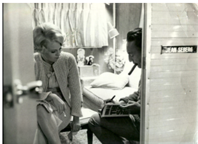
Jean Seberg und Romain Gary

Photographien und Dokumente aus dem Familienarchiv Mit einem Text von Antoine de Baecque 200 Seiten, 245 Abb. in Farbe ISBN 978-3-8296-0674-5 € 39.80, € (A) 41.-, CHF 52.90 Soeben erschienen