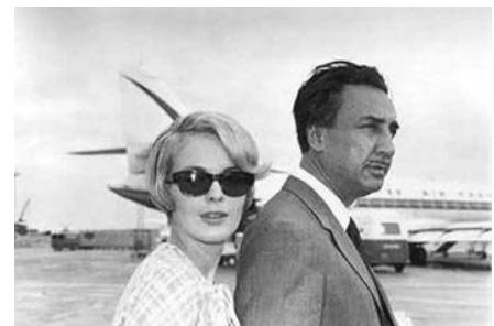
Jean Seberg und Romain Gary