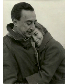
Romain Gary, Jean Seberg, Paris 1961