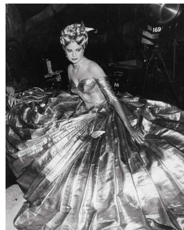
8) Grace Kelly in Hitchcocks To Catch a Thief , Setphoto, 1955