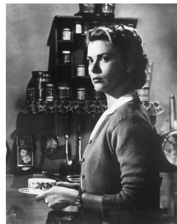
5) Grace Kelly als Georgie Elgin in The Country Girl , Filmportrait, 1954