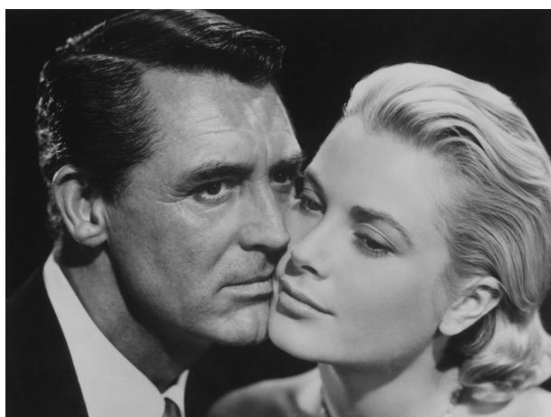
9) Cary Grant und Grace Kelly, Publicity-Portrait für Hitchcocks To Catch a Thief , 1955