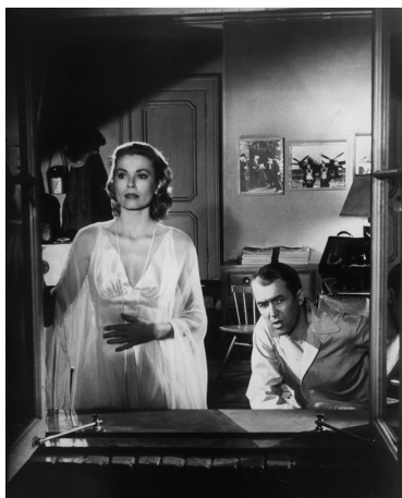
4) Grace Kelly und James Stewart in Hitchcocks Rear Window , 1954