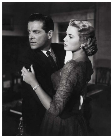
2) Grace Kelly und Mark Halliday in Hitchcocks Dial M for Murder , 1954