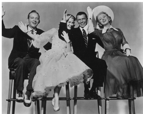
12) Die vier Hauptdarsteller von High Society , Filmportrait, 1956