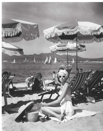
7) Grace Kelly als Frances am Strand des Hotel Carlton in Cannes, Filmstill aus To Catch a Thief , 1955