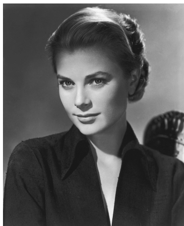
6) Filmportrait für Green Fire , 1954