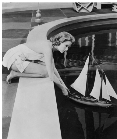
11) Grace Kelly als Daisy in High Society , Filmstill, 1956