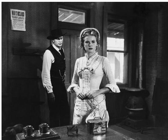
1) Gary Cooper, Grace Kelly. Filmstill aus High Noon , 1952