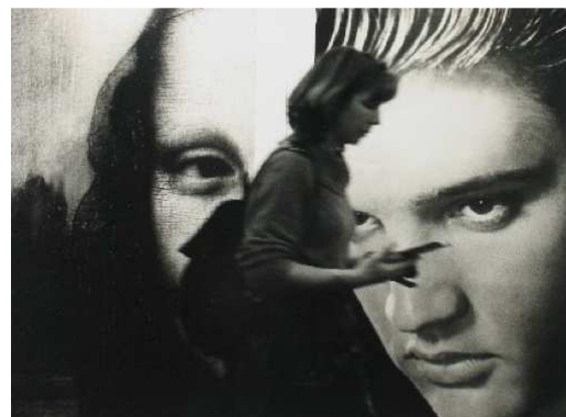
13) Barbara Klemm: Zwischen Leonardo und Elvis, Schirmer/Mosel-Stand auf der Frankfurter Buchmesse 2002