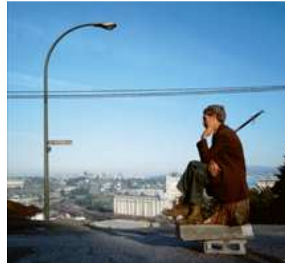
2) Jeff Wall: The Thinker, 1986. Aus dem Buch: Jeff Wall in München