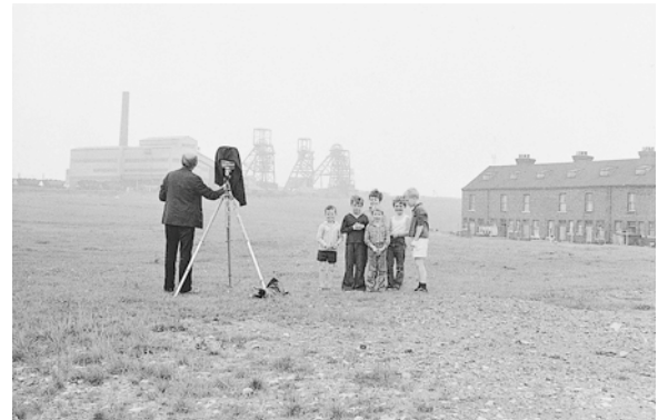
5) Hilla Becher: Bernd Becher beim Photographieren im nordenglischen Bergbaurevier, 1968. Aus dem Buch: Susanne Lange: Bernd und Hilla Becher. Leben und Werk