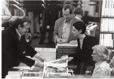
28) Signierstunde mit Richard Avedon (re.), Buchhandlung Walther König, Köln 1986