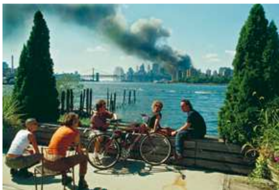
12) Thomas Hoepker: Blick von Williamsburg, Brooklyn, auf Manhattan, 11. September 2001. Titelbild des Buches: Thomas Hoepker, Photographien 1955-2005