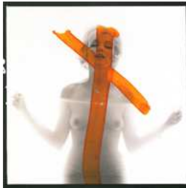
4) Bert Stern: Marilyn Monroe, The Last Sitting, Los Angeles 1962. Aus dem Buch: Marilyn Monroe/Bert Stern, The Last Sitting