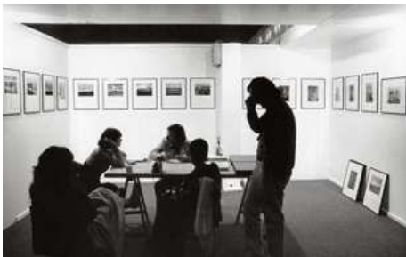
21) Schirmer/Mosel Messekoje, Art Basel, 1974.