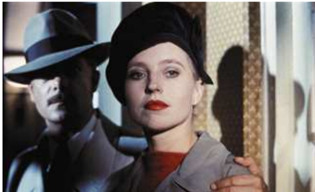
9) Hanna Schygulla, Filmstill aus: Lili Marleen, 1981. Aus dem Buch: Du ... Augen wie Sterne. Das Hanna Schygulla Album