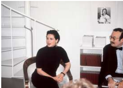
30) Isabella Rossellini und Lothar Schirmer, Schirmer/Mosel Showroom, München 1997