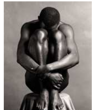
8) Robert Mapplethorpe: Ajitto, 1981. Aus dem Buch: Robert Mapplethorpe, The Black Book