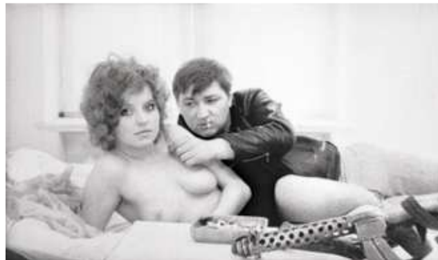
7) Hanna Schygulla und Rainer Werner Fassbinder, Filmstill aus: Liebe ist kälter als der Tod , 1969. Aus dem Buch: Hanna Schygulla, Bilder aus Filmen von R.W. Fassbinder