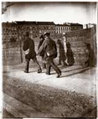
3) Heinrich Zille: Charlotten- Straße, Berlin 1898. Aus dem Buch: Heinrich Zille, Photographien Berlin 1890-1910