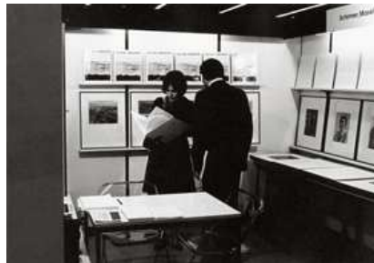
22) Erste Buchmesse in Frankfurt, 1974.