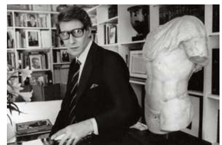
26) Yves Saint Laurent, ca. 1988. Im Hintergrund das Schirmer/Mosel- Buch Joseph Albert - Hofphotograph der Bayerischen Könige.