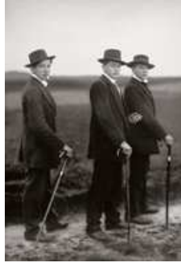
1) August Sander: Jungbauern, 1914. Aus dem Buch: August Sander, Menschen des 20. Jahrhunderts