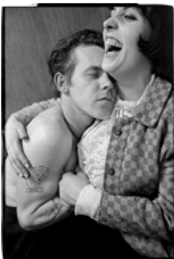
6) Anders Petersen: Lilly und Rose, Café Lehmitz, Hamburg 1968. Titelbild des Buches: Anders Petersen, Café Lehmitz 4