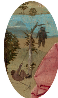
9) Detail aus Der Heilige Christophorus