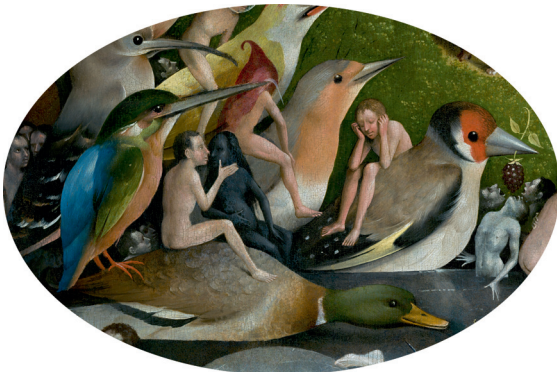
8) Detail aus Der Garten der Lüste , Mitteltafel