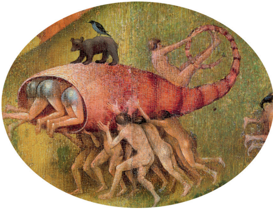
6) Detail aus Der Garten der Lüste , Mitteltafel

- Fortsetzung - Pressebilder Cees Nooteboom