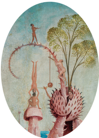
1) Detail aus Der Garten der Lüste , Mitteltafel

Cees Nooteboom Reisen zu Hieronymus Bosch Eine düstere Vorahnung Neuaufgabe 80 Seiten, 67 Farbabbildungen ISBN 978-3-8296-0746-9 Lp. € 29,80 €(Ö) 30,70 CHF 34,30