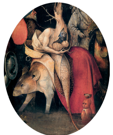
5) Detail aus Die Versuchung des Heiligen Antonius , Mitteltafel