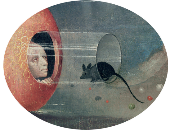
7) Detail aus Der Garten der Lüste , rechte Tafel