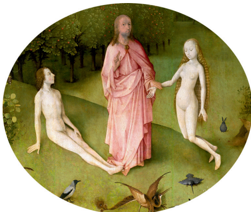
10) Detail aus Der Garten der Lüste , linke Tafel