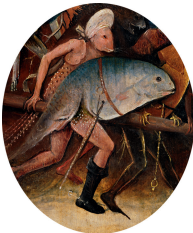
3) Detail aus Der Heuwagen , Mitteltafel