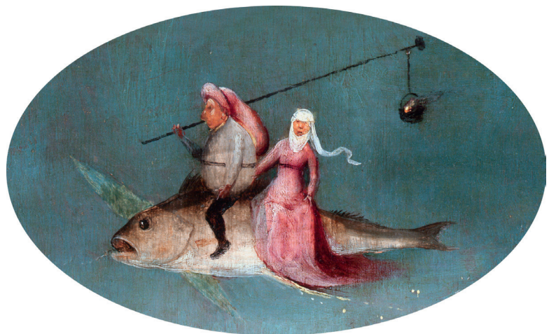
2) Detail aus Die Versuchung des Heiligen Antonius , rechte Tafel