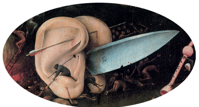
11) Detail aus Der Garten der Lüste , rechte Tafel