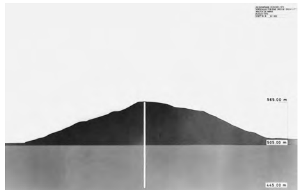
11.) Vorschlag für eine Erdsulptur , 1970 (für die Olympischen Spiele in München 1972)