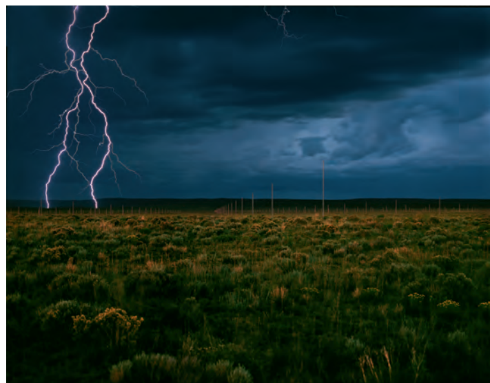
5.) The Lightning Field , 1977 Hochebene bei Quemado, New Mexico