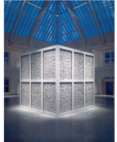
3.) 5 Continent Sculpture , 1988–2022 Mercedes Benz AG, Stuttgart-Möhringen