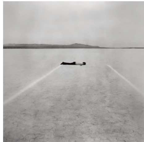
9.) Mile Long Drawing , Mojave-Wüste, Kalifornien, 1968