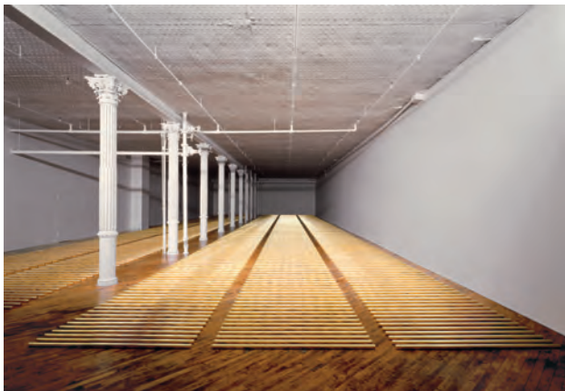
8.) The Broken Kilometer , 1979 Dia Center for the Arts, New York