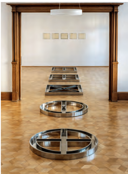
4.) Variations on Three Squares and Two Circles , 1974 Privatsammlung München