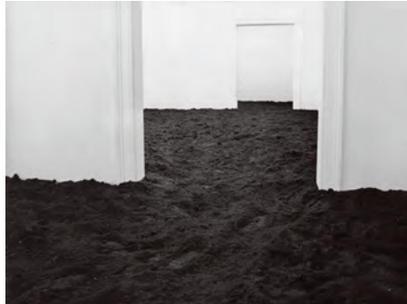
2.) Munich Earth Room , 1968 Galerie Friedrich, München