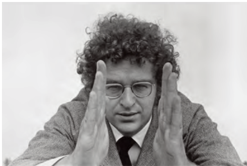
1.) Walter De Maria, Hamburg-Fuhlsbüttel, 1968.