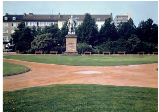
7.) The Vertical Earth Kilometer , 1977 Friedrichsplatz, Kassel