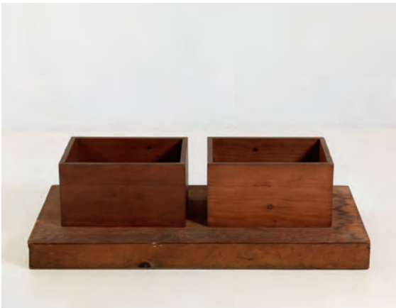
6.) Boxes for Meaningless Work , 1961. The Menil Collection, Houston

- Fortsetzung - Pressebilder Walter De Maria - Eine Werkübersicht