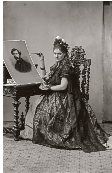
8) Pierre-Louis Pierson, Die Contessa di Castiglione als Malerin , 1895