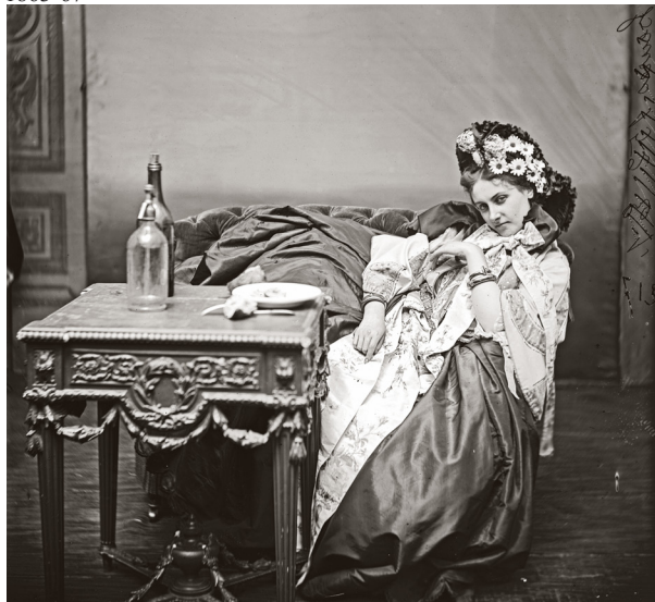
9) Pierre-Louis Pierson, Die Contessa di Castiglione als Trinkerin , Mimuit (Mitternacht) , 1861-67