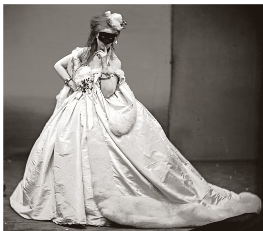
5) Pierre-Louis Pierson, Die Contessa di Castiglione, Silence (Stille) , 1861-67