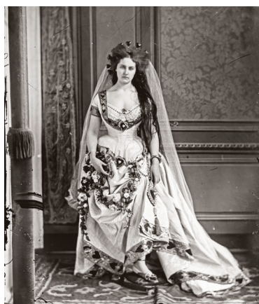
1) Pierre-Louis Pierson, Die Herzkönigin , 1861-63

Catharina Berents Contessa di Castiglione Die Femme fatale des Second Empire 176 Seiten, 65 farbige Abbildungen ISBN 978-3-8296-0976-0 Lp. € 39,80 €(Ö) 41,- CHF 45,80