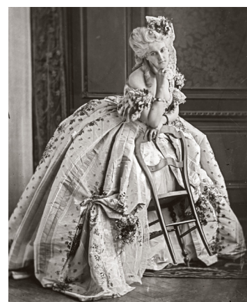
3) Pierre-Louis Pierson, Die Contessa di Castiglione als Marquise Mathilde , 1861-66