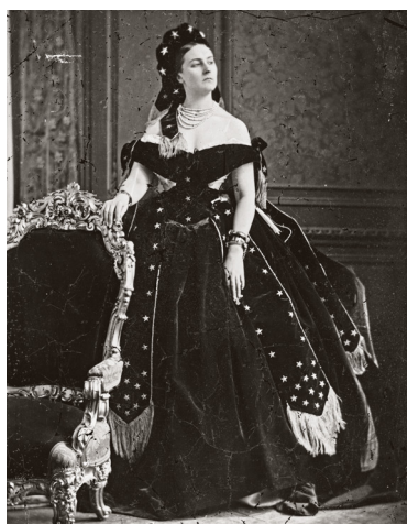
4) Pierre-Louis Pierson, Die Contessa di Castiglione, Die Königin der Nacht , 1861-63