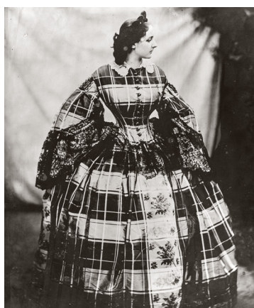
2) Pierre-Louis Pierson, Die Contessa di Castiglione in hochgeknöpftem Karokleid , 1856-57