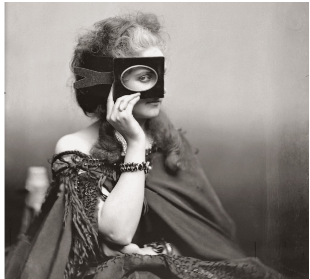
10) Pierre-Louis Pierson, Die Contessa di Castiglione , Serie Scherzo di Follia (Witz der Verrücktheit) , 1861-67