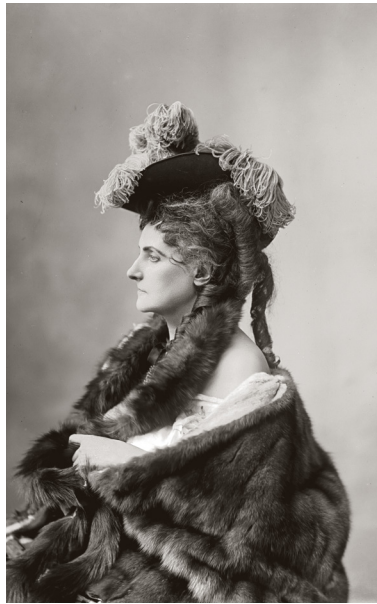
7) Pierre-Louis Pierson, Die Contessa di Castiglione , 1875-80