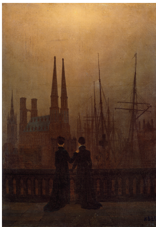
Kat. 4 Die Schwestern auf dem Söller am Hafen ( Nächtlicher Hafen ), Öl auf Leinwand, um 1820