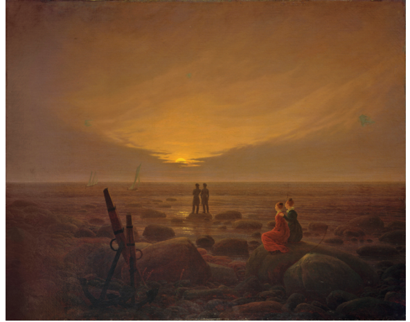
Kat. 5 Mondaufgang am Meer , Öl auf Leinwand, 1821