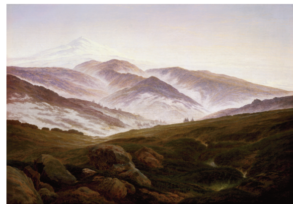
Kat. 12 Erinnerung an das Riesengebirge , Öl auf Leinwand, 1835