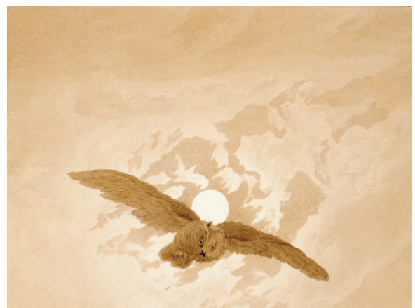
Kat. 16 Eule vor dem Mond , Bleistift und Sepia, umrandet mit schwarzer Tusche, 1836-1837