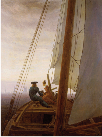
Kat. 3 Auf dem Segler , Öl auf Leinwand, 1818-1819