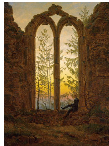
Kat. 13 Der Träumer , Öl auf Leinwand, um 1835