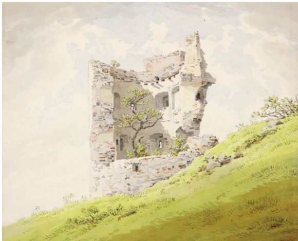
Kat. 8 Ruine auf dem Schlossberg , Bleistift und Aquarell, 1828