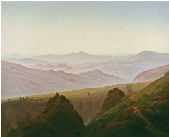
Kat. 6 Morgen im Gebirge , Öl auf Leinwand, 1822-1823