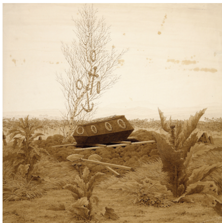
Kat. 15 Sarg am Grab , Bleistift und Sepia, um 1836