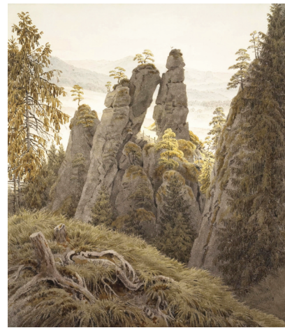
Kat. 20 Das Tor auf dem Neurathen , Aquarell und Bleistift, umrandet mit schwarzer Tusche, um 1837-1840