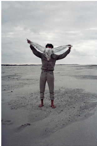
6) Albatros, 1968