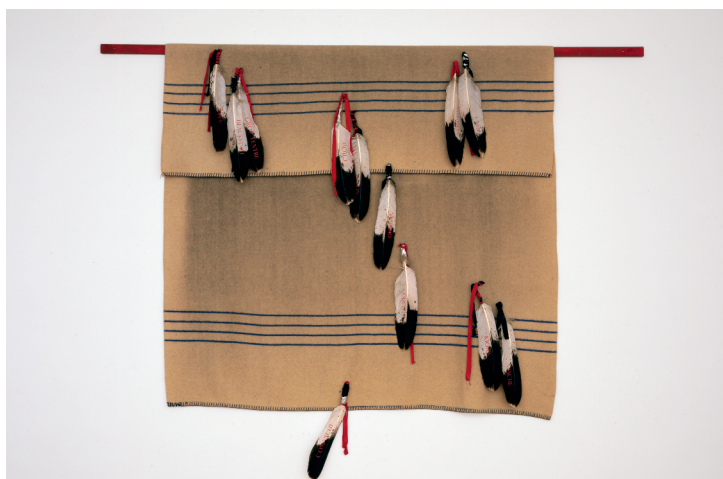
1) Ohne Titel , 1974