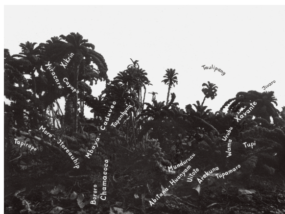
10) Amazonas-Kosmos (Grünnkohl), 1969/1971