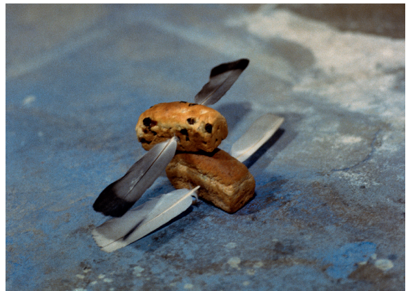
2) Zwei Moskitos , 1969