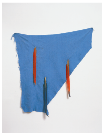
3) Blaues Tuch mit drei Ararafedern , 1969