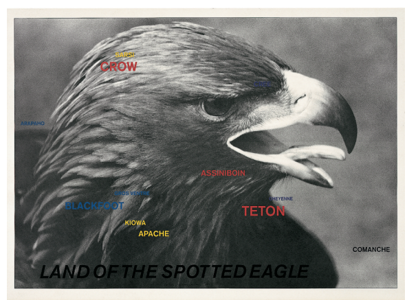
11) Land of the Spotted Eagle, 1983