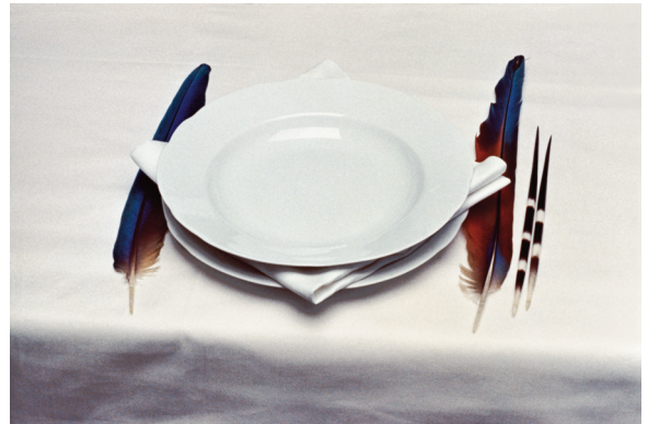
7) Vom Ursprung der Tischsitten, 1971