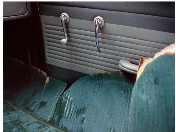
9) VW Do Brasil, 1972