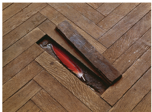
5) Kultur - Natur , 1971